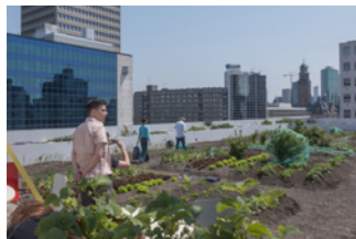
Vrtnarjenje na strehah Rotterdama

Vse več prebivalcev v mestih proizvaja, distribuira in porablja urbano pridelano hrano ter na ta način ustvarja ECS.