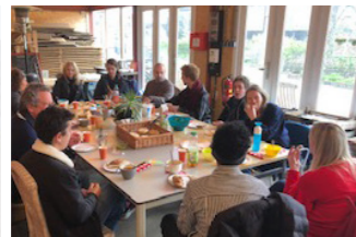
Skupinsko kuhanje v Oslu