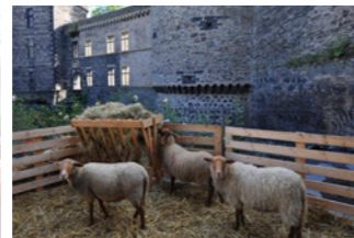
Gojenje ovc v Andernachtu