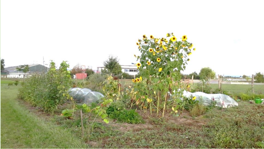
Parzellen für Bürger