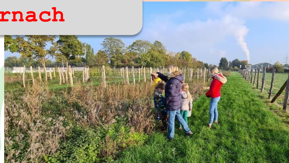
Gemeinschaftsgarten Jugendzentrum Freizeitprogramm