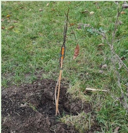
Fluthilfe - Baumzucht