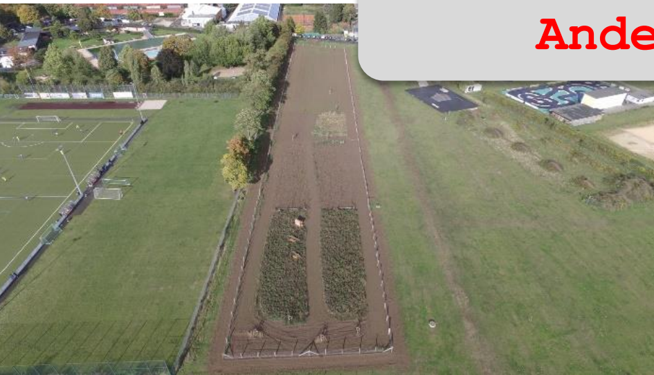
Luftbild Gemeinschaftsgarten (8000 m 2 )